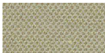
nina | 1102