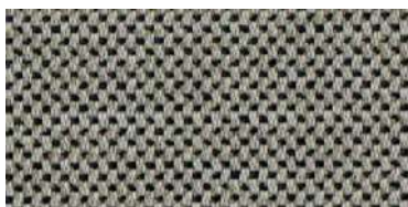
nina | 1119