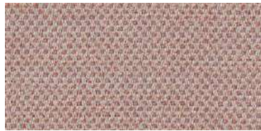
nina | 1104