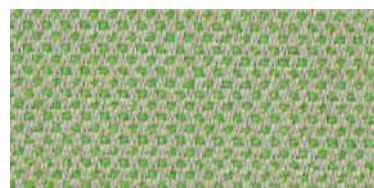
nina | 1112