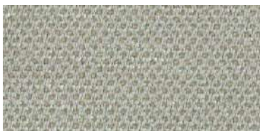
nina | 1113