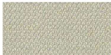
nina | 1101