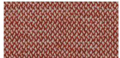
nina | 1124