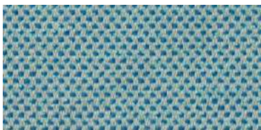
nina | 1115