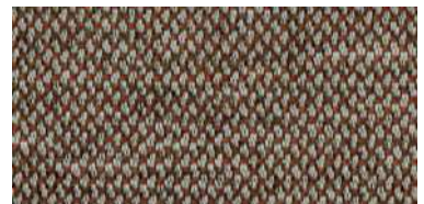
nina | 1126