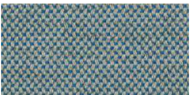
nina | 1125