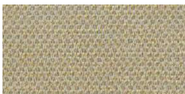
nina | 1111