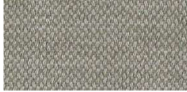
nina | 1123