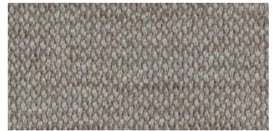
nina | 1127