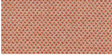
nina | 1117