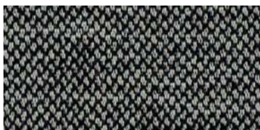
nina | 1129