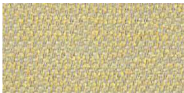
nina | 1118