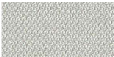
nina | 1100