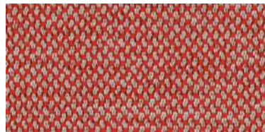
nina | 1114