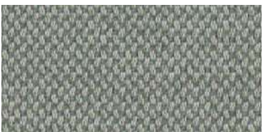
nina | 1109