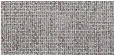
DARU | 101