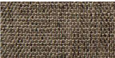
DARU | 104