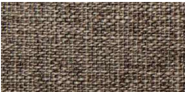
DARU | 105