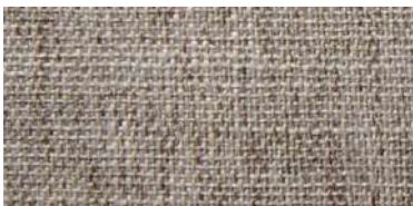
DARU | 103