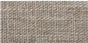
DARU | 102