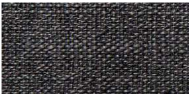
DARU | 107