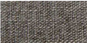
DARU | 106