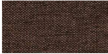
Tapaluz DC | 5019