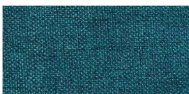
Tapaluz DC | 5056