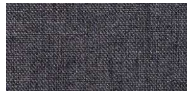
Tapaluz DC | 5023