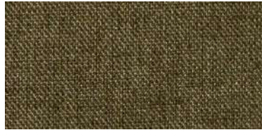
Tapaluz DC | 5115