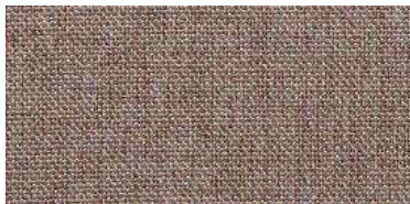
Tapaluz DC | 5106