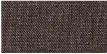
Tapaluz DC | 5126