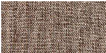
Tapaluz DC | 5003