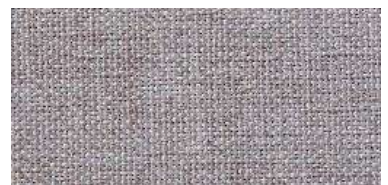
Tapaluz DC | 5021