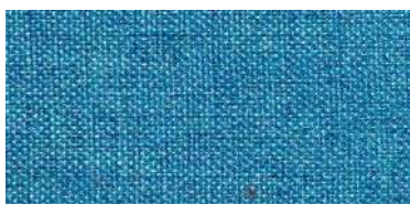
Tapaluz DC | 5055