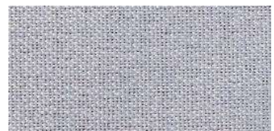
Tapaluz DC | 5001