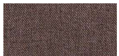
Tapaluz DC | 5129