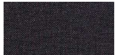
Tapaluz DC | 5012