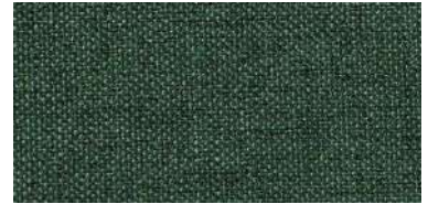
Tapaluz DC | 5121