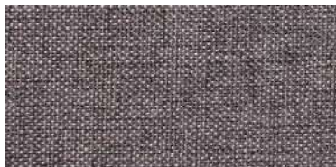
Tapaluz DC | 5020