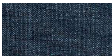
Tapaluz DC | 5078