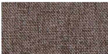
Tapaluz DC | 5008