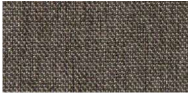
Tapaluz DC | 5108