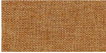
Tapaluz DC | 5011