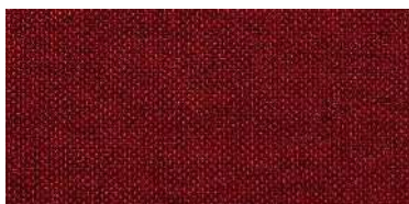
Tapaluz DC | 5027