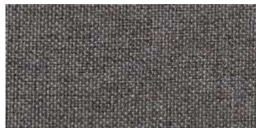
Tapaluz DC | 5112