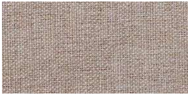
Tapaluz DC | 5002