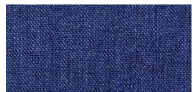
Tapaluz DC | 5083