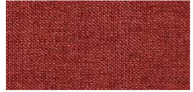
Tapaluz DC | 5009