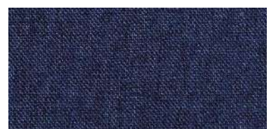
Tapaluz DC | 5084