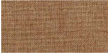
Tapaluz DC | 5117