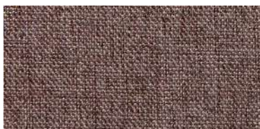
Tapaluz DC | 5022