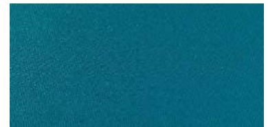
Tapaluz Classic | 8001