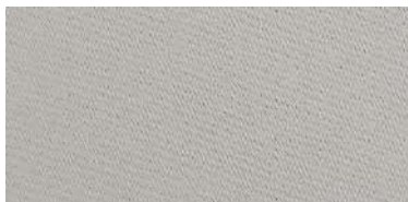
Tapaluz Classic | 802