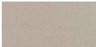
Tapaluz Classic | 804