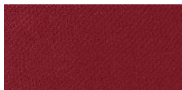
Tapaluz Classic | 814