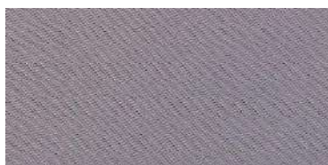
Tapaluz Classic | 821