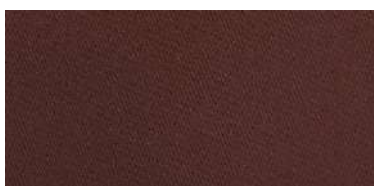
Tapaluz Classic | 819