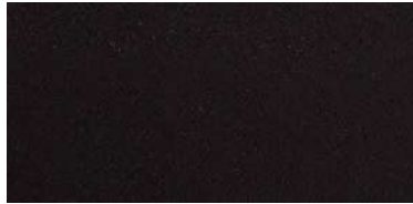
Tapaluz Classic | 805