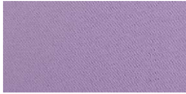
Tapaluz Classic | 826