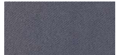
Tapaluz Classic | 823