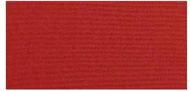
Tapaluz Classic | 815