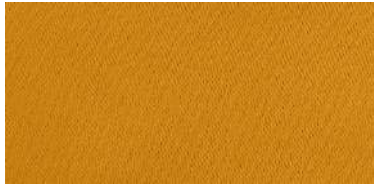
Tapaluz Classic | 810