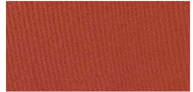
Tapaluz Classic | 809