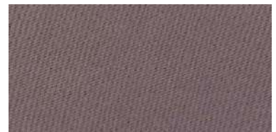
Tapaluz Classic | 808