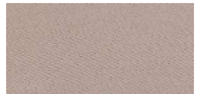
Tapaluz Classic | 803