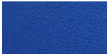
Tapaluz Classic | 8004