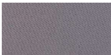
Tapaluz Classic | 820