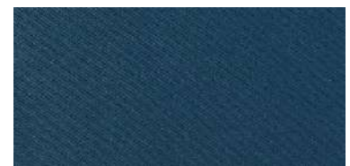
Tapaluz Classic | 8002