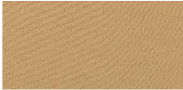
Tapaluz Classic | 811