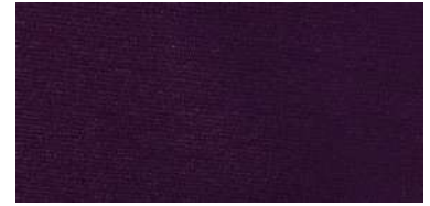
Tapaluz Classic | 825