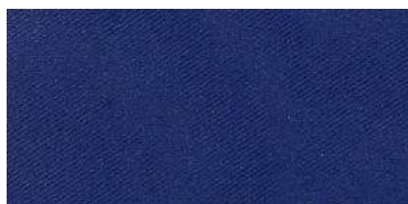
Tapaluz Classic | 8003