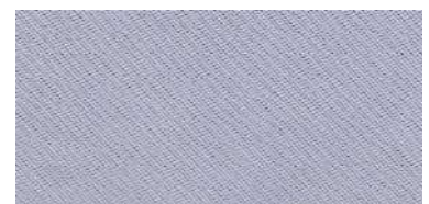
Tapaluz Classic | 801