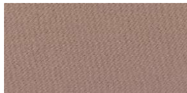
Tapaluz Classic | 822