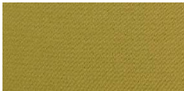
Tapaluz Classic | 806