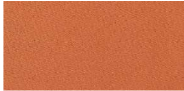
Tapaluz Classic | 807