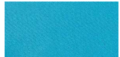
Tapaluz Classic | 855