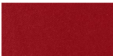
Tapaluz Classic | 827