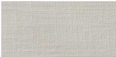
SE | 12