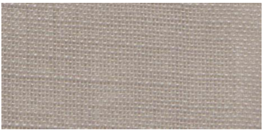
SE | 14