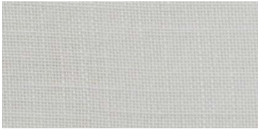
SE | 02