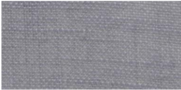
SE | 17