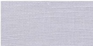
SE | 01