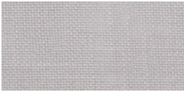
SE | 16