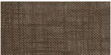
SE | 15