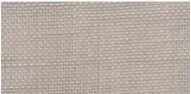
SE | 13