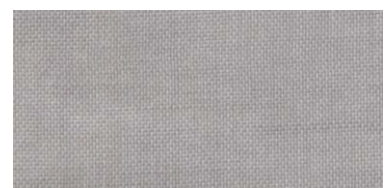
ET-TH | 1273