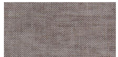
ET-TH | 8087