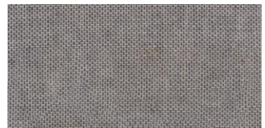
ET-TH | 7766