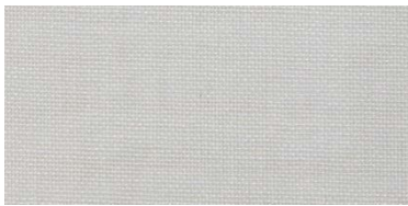
ET | 02