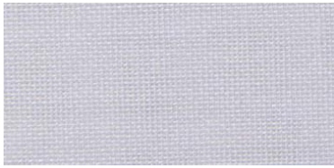
ET | 01