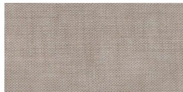
ET-TH | 1286