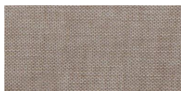
ET-TH | 7455