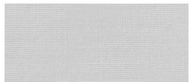
ET | 22/25