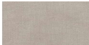
ET-TH | 1126