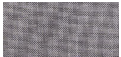
ET-TH | 4030