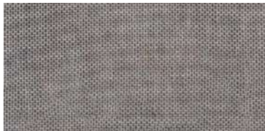
ET-TH | 7766