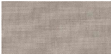
ET-TH | 1286