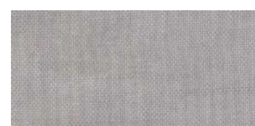
ET-TH | 1273