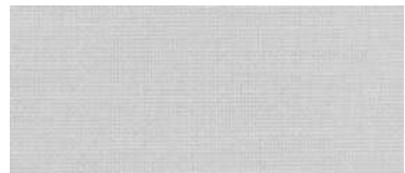
ET | 22/25