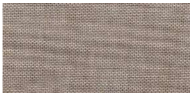
ET-TH | 7455