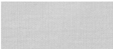
ET | 22/15