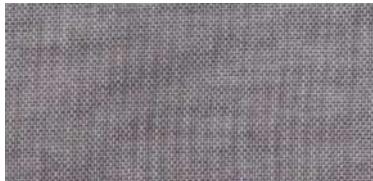
ET-TH | 4030