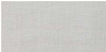
ET | 02