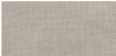
ET-TH | 1126