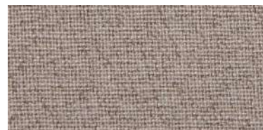
DAN | 57