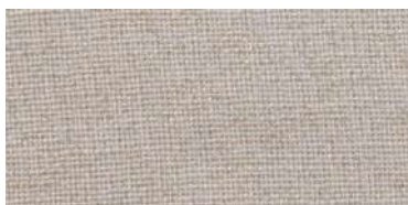
DAN | 47