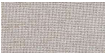
DAN | 27