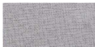
DAN | 28