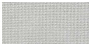
NIL | 02