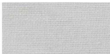
NIL | 03