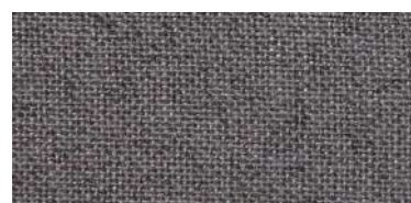
DAN | 96