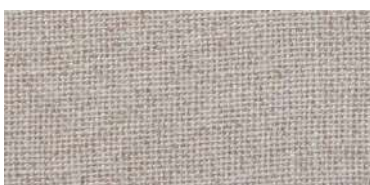
DAN | 34