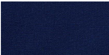
Saba 2 | 65