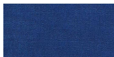
Saba 2 | 85