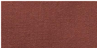
Saba 2 | 27