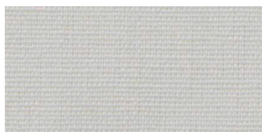
Saba 2 | 32