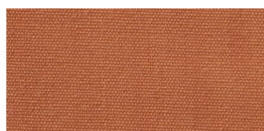
Saba 2 | 78