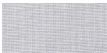
Saba 2 | 09