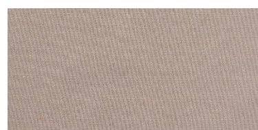
Saba 2 | 97