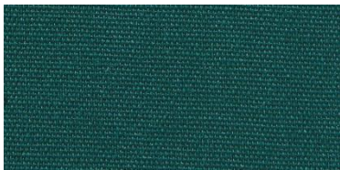
Saba 2 | 69