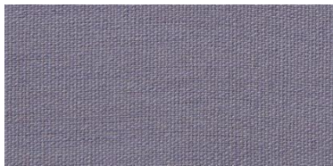
Saba 2 | 18