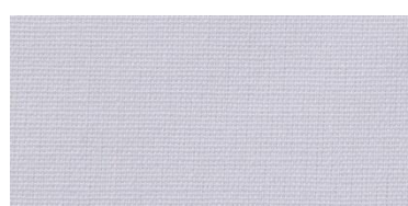
Saba 2 | 01