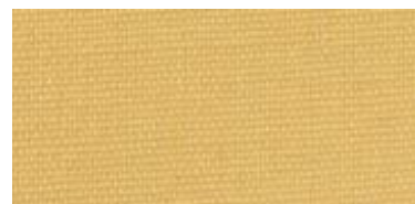
Saba 2 | 51