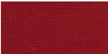
Saba 2 | 73