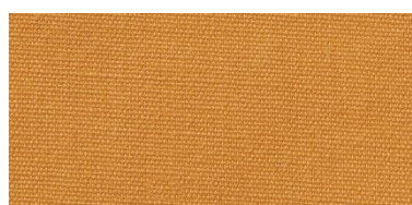
Saba 2 | 11