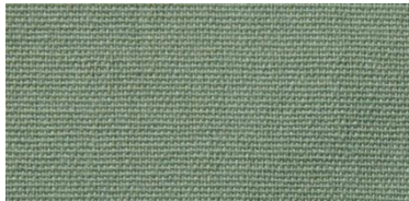
Saba 2 | E06