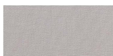
Saba 2 | 49