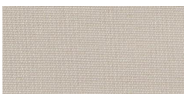
Saba 2 | 77