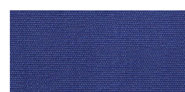
Saba 2 | 75