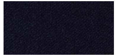
927 | Nocturno