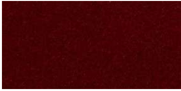
980 | Rojo teatro