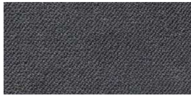
804 | Gris