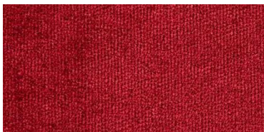
610 | Granate