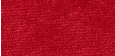
626 | Rojo