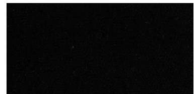
620 | Negro