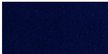
623 | Azul