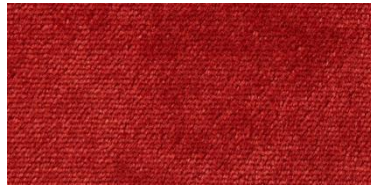
607 | Teja