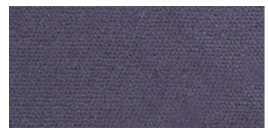
628 | Plata