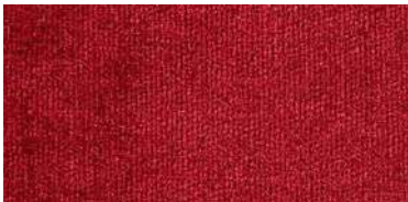
610 | Granate