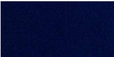
623 | Azul