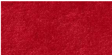
626 | Rojo