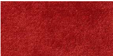
607 | Teja