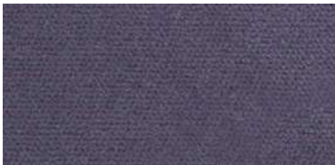
628 | Plata