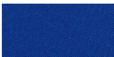
RON 2 | 224