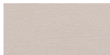
RON 2 | 202