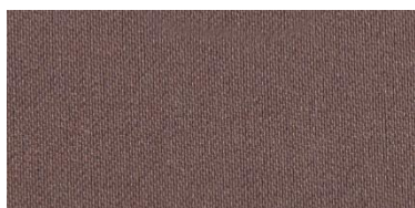
RON 2 | 220