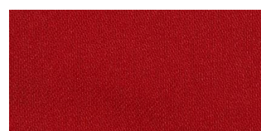
RON 2 | 208