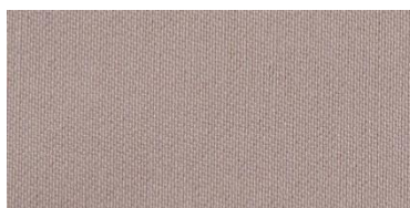
RON 2 | 219