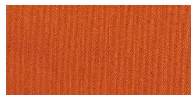
RON 2 | 206