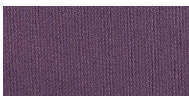
RON 2 | 243