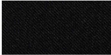
RON 2 | 217