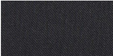
RON 2 | 216