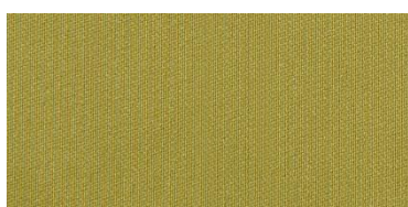
RON 2 | 247