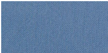
RON 2 | 212