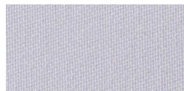
RON 2 | 201