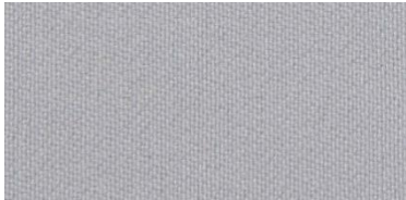
RON 2 | 218