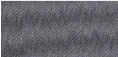
RON 2 | 256