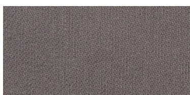
RON 2 | 215