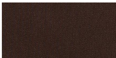
RON 2 | 244