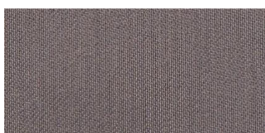
RON 2 | 258