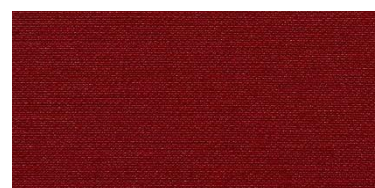
RON 2 | 246