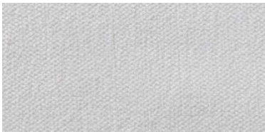
Gregal | 80