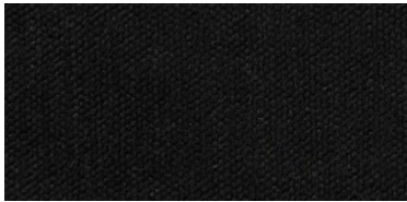
Gregal | 8025