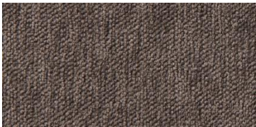
Gregal | 8022