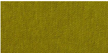
Gregal | 8027