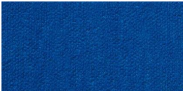
Gregal | 8030