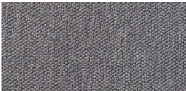
Gregal | 8024