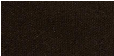
Gregal | 8023