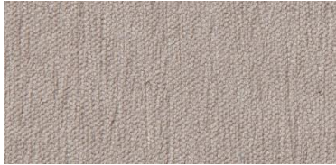
Gregal | 01