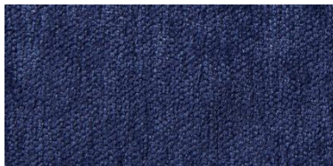
Gregal | 8031