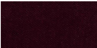
Gregal | 8029