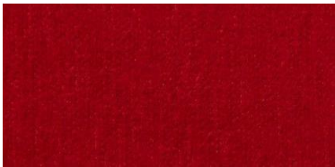
Gregal | 926