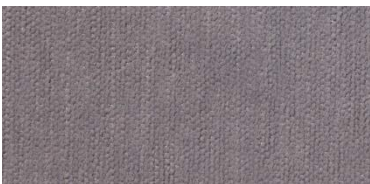
Gregal | 85