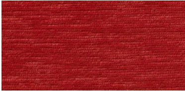
Gregal | 84