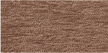
Gregal | 8020