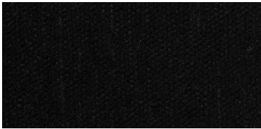
Gregal | 8019