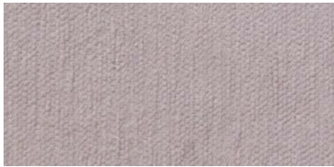
Gregal | 81