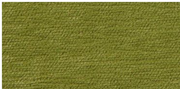
Gregal | 8026