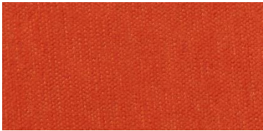
Gregal | 8028